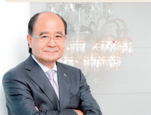
バカラ パシフィック株式会社 代表取締役社長